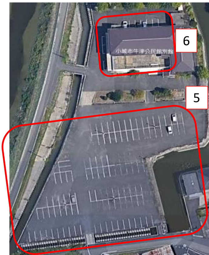
図2 牛津公民館別館周辺